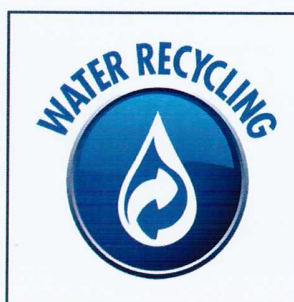
RICIRCOLO ACQUA WATER RECYCLING CONTROL EMISIÓN AGUA