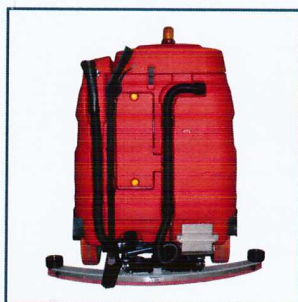
LANCIA DI LAVAGGIO E ASCIUGATURA WASHING AND DRYING NOZZLE LANZA DE LAVADO Y SECADO