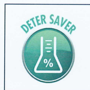
DOSATORE DETERGENTE ON BOARD ON BOARD DETERGENT DOSING SYSTEM DOSIFICACIÓN DETERGENTE A BORDO