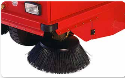
Braccio spazzola laterale Side brush arm Lateral izquierda