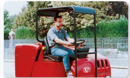
Tettuccio e convogliatore polvere Canopy and dust conveyor Techo y encaminador de polvo