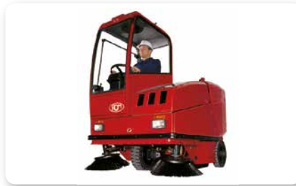
Cabina Cab Cabina